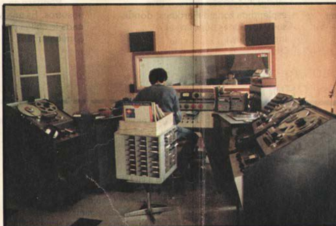
Aspecto parcial del control central de Radio Andorra